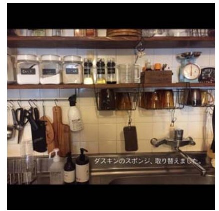
*ここに掲載しているスケッチや写真はイメージです。実際の現場とは異なります。